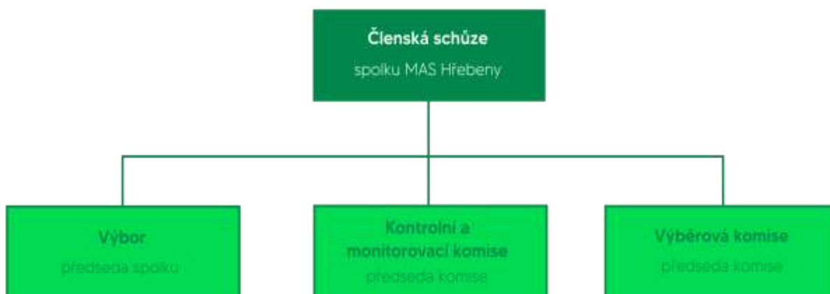
Organizační struktura MAS Hřebený, z.s.

Veškeré podrobnosti jsou uvedeny ve Stanovách. Způsob jednání jednotlivých povinných orgánů MAS je upraven příslušným jednacím a volebním řádem, které jsou (v aktuální i archivní verzi) zveřejněny na webu MAS: https://www.mashrebeny.cz/vyveska-a-dokumenty/