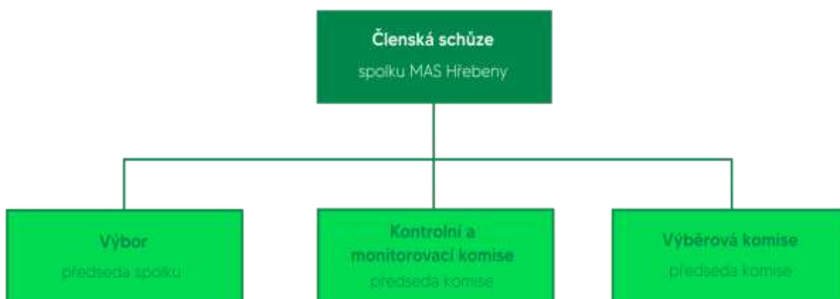
Organizační struktura MAS Hřebený, z.s.

Veškeré podrobnosti jsou uvedeny ve Stanovách. Způsob jednání jednotlivých povinných orgánů MAS je upraven příslušným jednacím a volebním řádem, které jsou (v aktuální i archivní verzi) zveřejněny na webu MAS: https://www.mashrebeny.cz/vyveska-a-dokumenty/